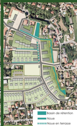
AEU Cailloux-sur-Fontaines